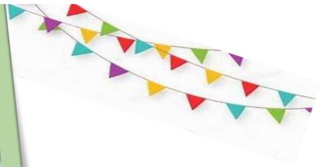
“Los aros llamativos”