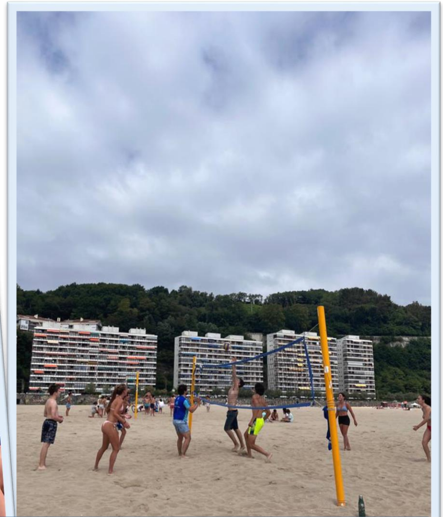
Otr@s charlar@on , se prepararon el Talent Show y jugaron al voleibol, el deporte estrella del camp.