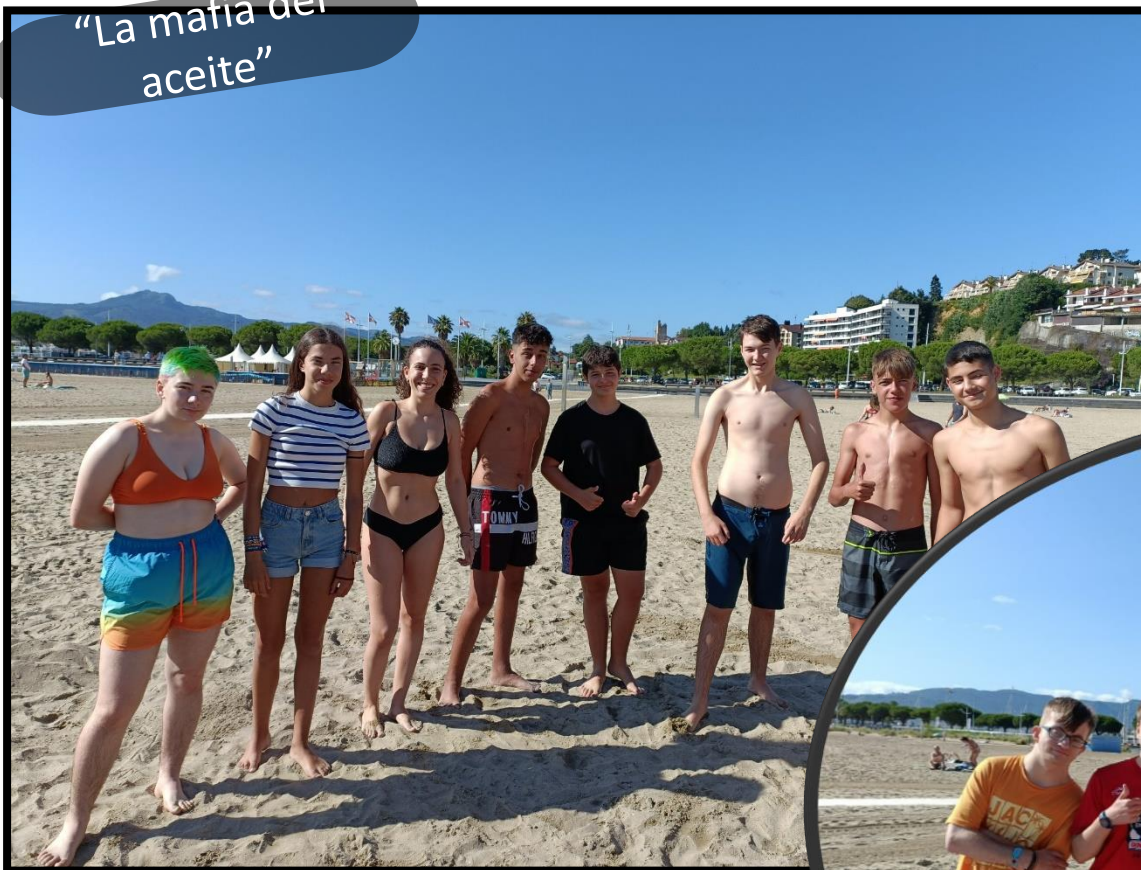
“La mafia del aceite”

Preparamos los equipos para la jornada de “Olymplaya” de hoy. ¡A continuación, os los presentamos!