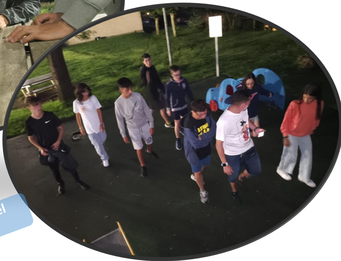
El juego de la pelota.